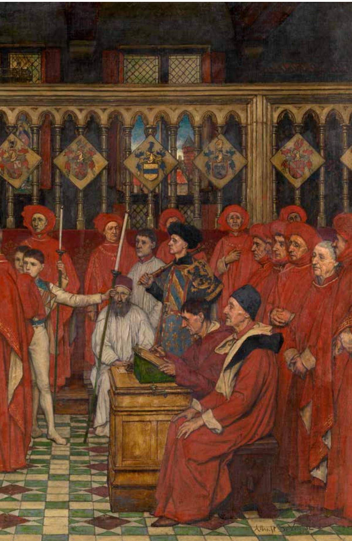
Albrecht De Vriendt Het eerste kapittel van het Gulden Vlies ca. 1893-1900 Antwerpen, KMSKA