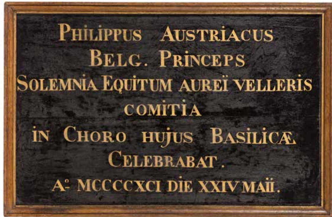
Anoniem Memoriepaneel van de kapittel- bijeenkomst in 1491 17de of 18de eeuw (?) Mechelen, Sint-Romboutskathedraal