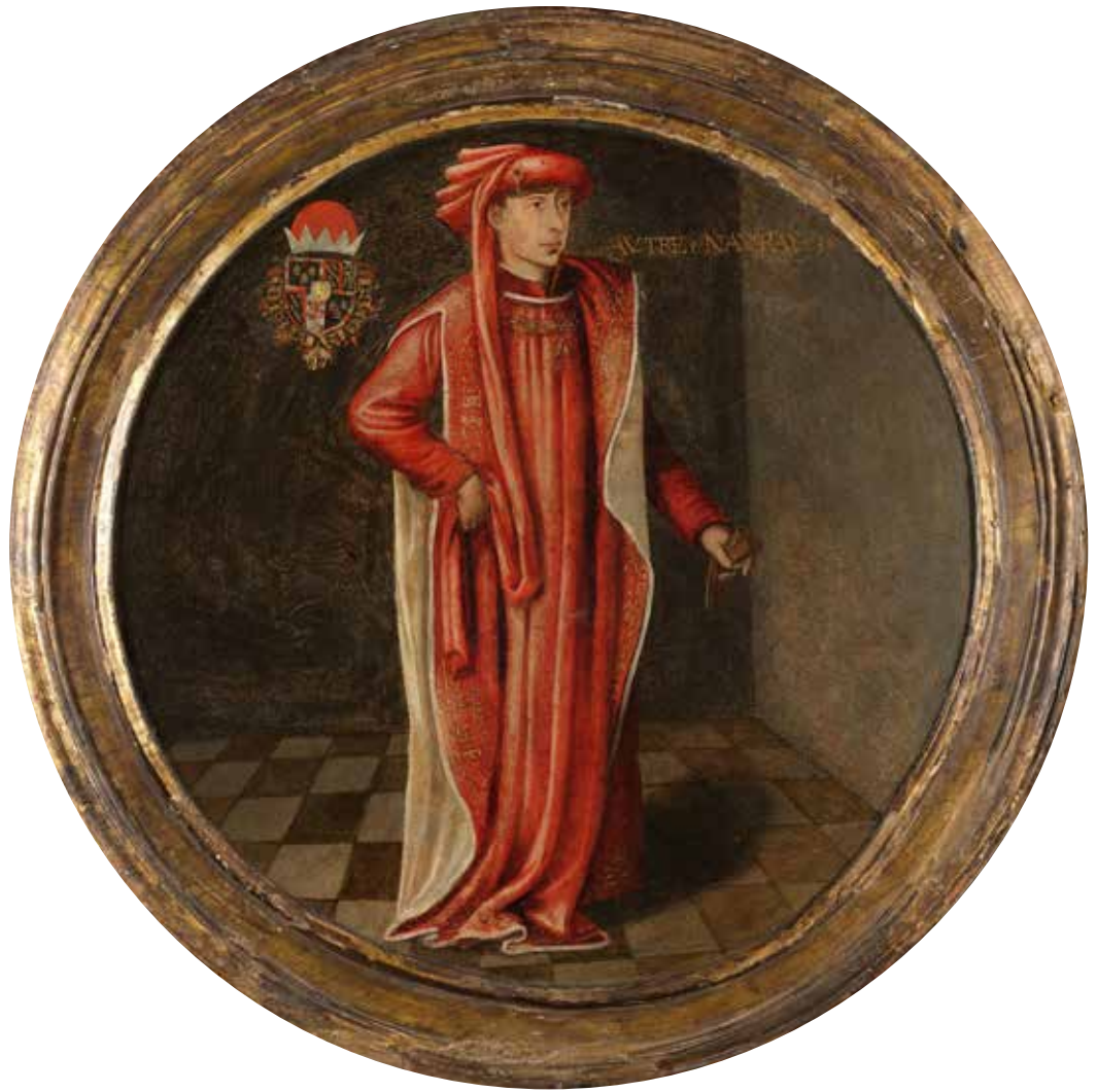
Anoniem Filips de Goede in roodfluwelen ordegewaad ca. 1460-1480 Amsterdam, Rijksmuseum

Die overgang heeft niet alleen gevolgen voor de Bourgondisch-Habsburgse Nederlanden, maar ook voor de Orde van het Gulden Vlies. Volgens de statuten is Maximiliaan, nadat zijn huwelijk met Maria is ontbonden, niet langer de aangewezen soeverein. De nieuwe soeverein van de orde moet een erfgenaam zijn van Filips de Goede en Bourgondisch bloed door zijn aderen hebben stromen. Op slechts vierjarige leeftijd is Filips de Schone de enige geschikte kandidaat om de nieuwe voorzitter van de ridderorde te worden. Deze kleuter wordt tegen wil en dank een absolute spilfiguur in de machtsspelletjes die zich ontvouwen in het voormalige Bourgondische Rijk.