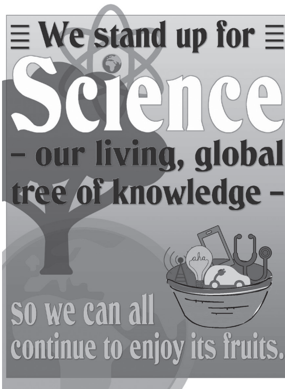
FIGUUR 1 Ontwerp van mijn bord voor de March for Science op 22 april 2017 in Brussel

De March for Science, waaraan ik deelnam, werd gehouden op de Dag van de Aarde (jaarlijks op 22 april). Op mijn plakkaat had ik de wetenschappen als een boom geschilderd, waar we maar wat graag de vruchten van plukken (figuur 1). Waarom ik die beeldspraak heb gekozen, ontdek je ook in dit boek.