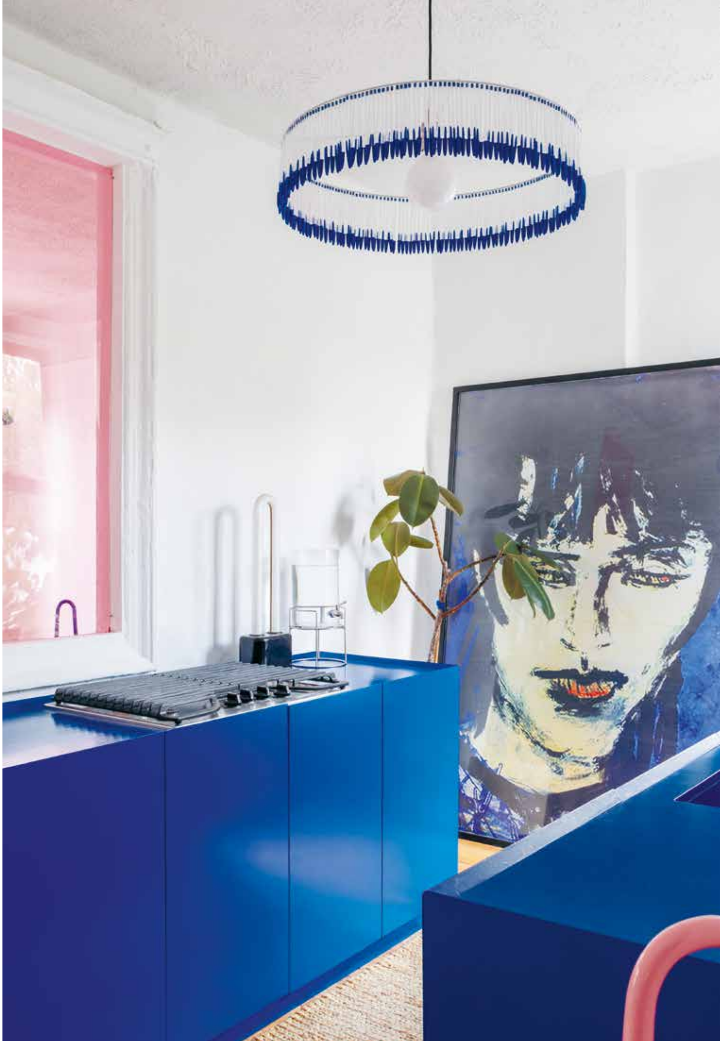
De grote poster in de keuken is van de Russische zanger Viktor Tsoi, die in de jaren tachtig razend populair was. Volgens Nuriev 'de Patti Smith van Rusland'.