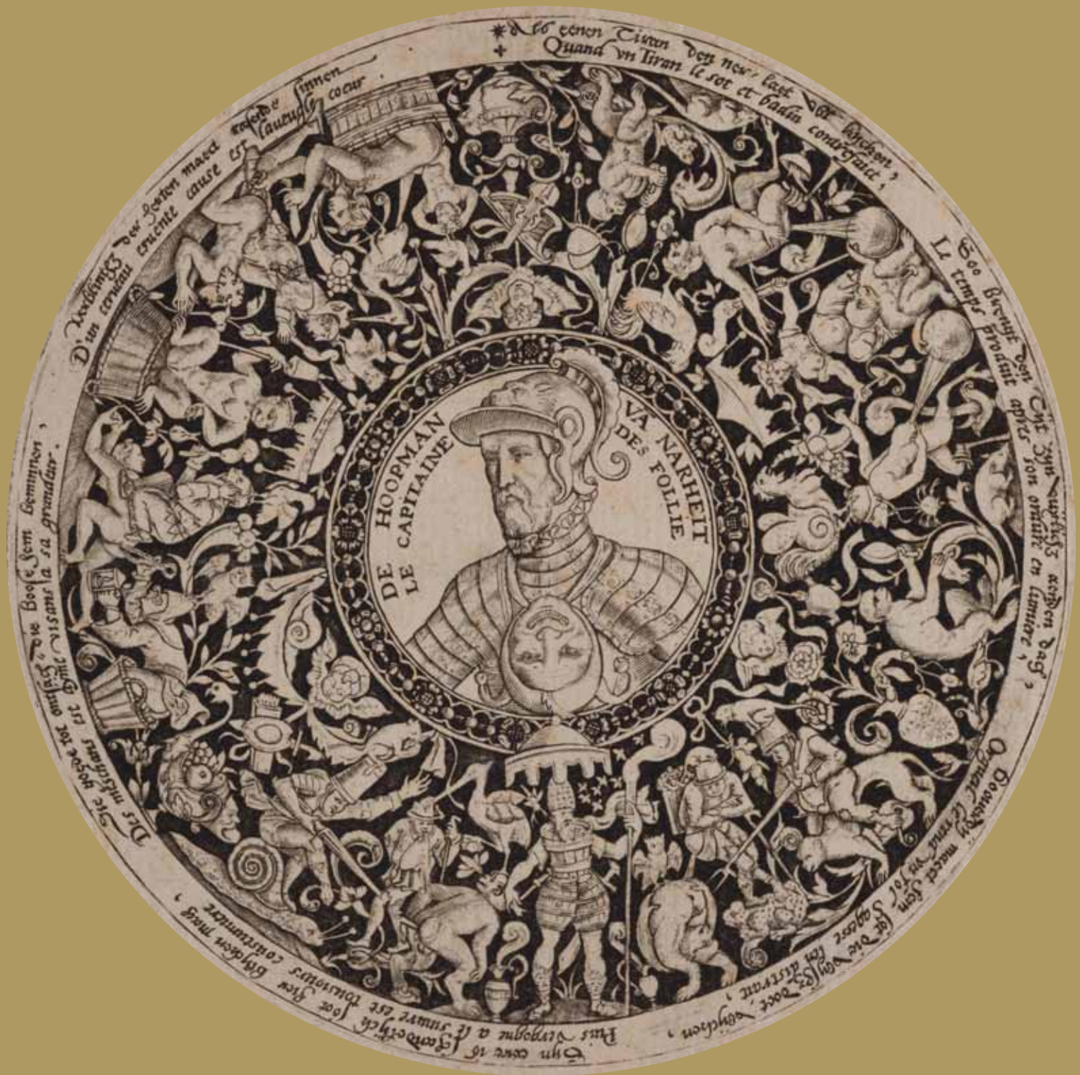
Theodor de Bry Spotprent met de hertog van Alva, ca. 1578 Gravure, 125 x 105 mm