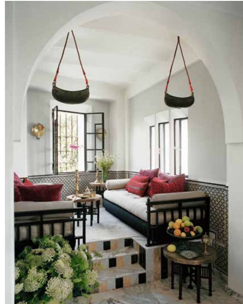
In een van de kleine salons in oosterse stijl herinneren architectonische details en meubelstukken aan de talrijke reizen die de eigenaars hebben gemaakt in het Verre Oosten.