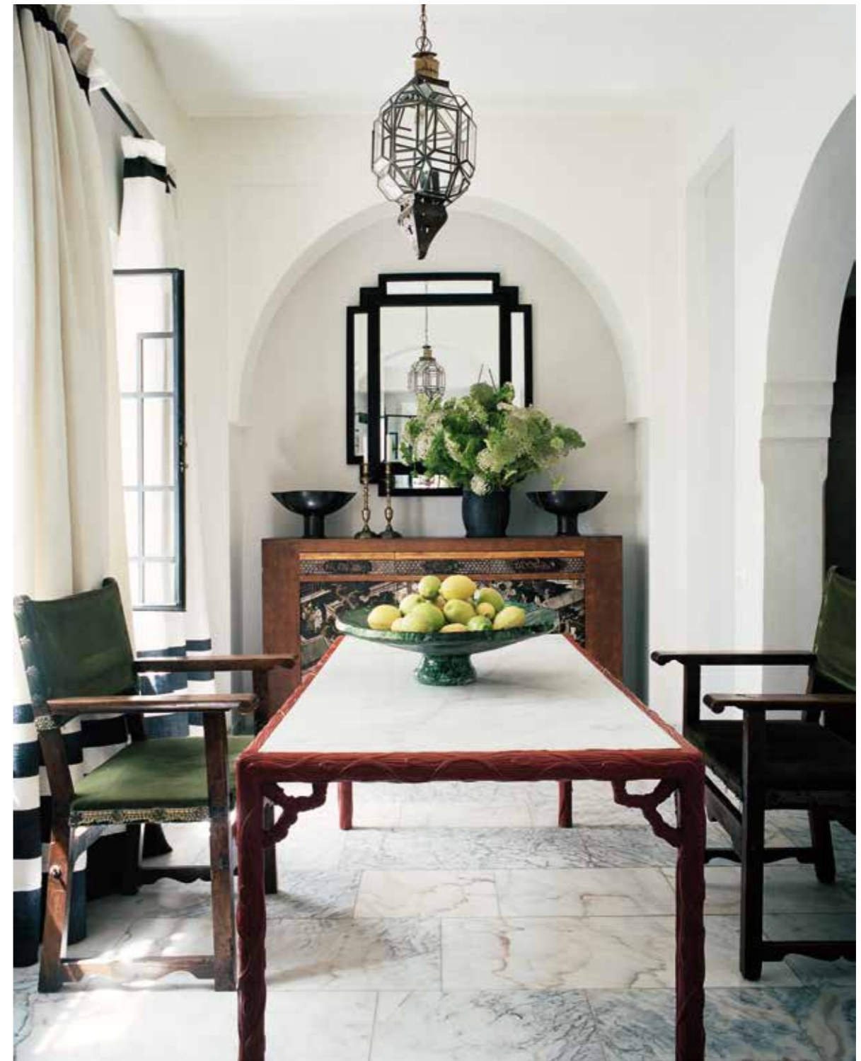
De Chinese buffetkast met deuren die zijn bedekt met coromandel-lakwerk past perfect in de kamer. Rond de tafel in Chinese stijl, afkomstig van de Parijse vlooiemarkt Saint-Ouen, staan twee 19de-eeuwse Spaanse stoelen.