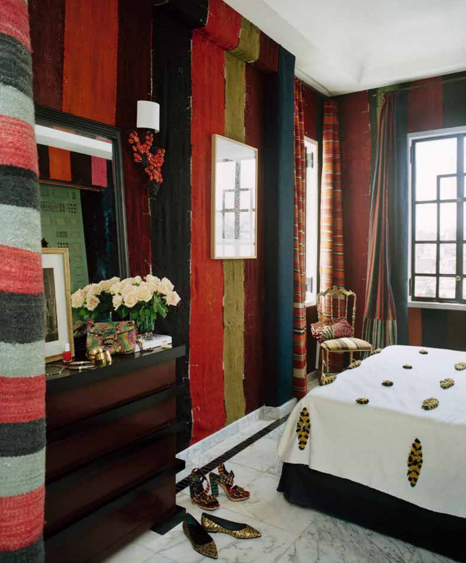
Een van de kamers is geïnspireerd op een berbertent. De muren zijn bedekt met Marokkaanse tapijten.