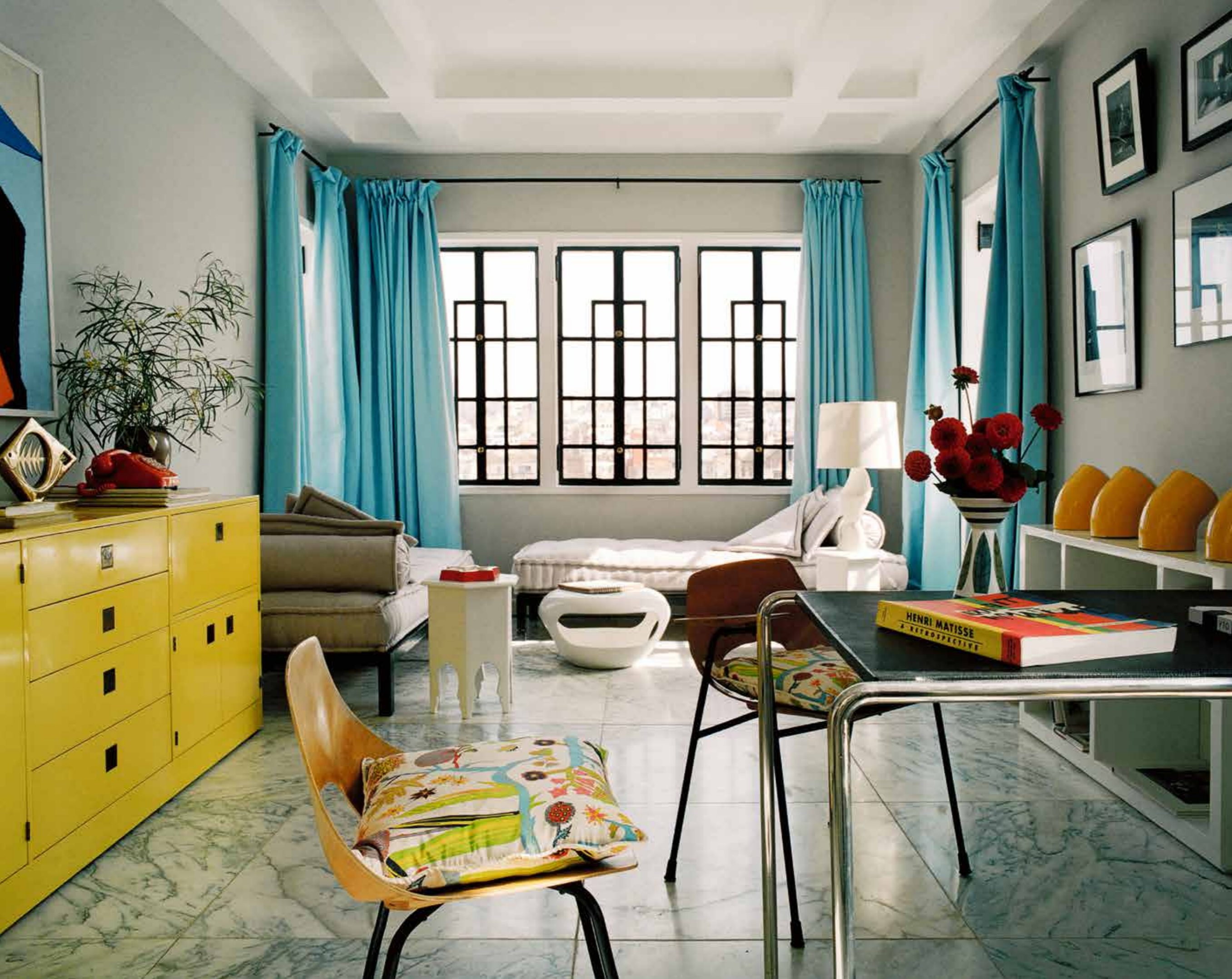
De grote gele buffetkast uit de jaren zeventig, gevonden in de Paul Smith Gallery in Londen, naast de Tonneau-stoelen uit de jaren vijftig van Pierre Guariche.