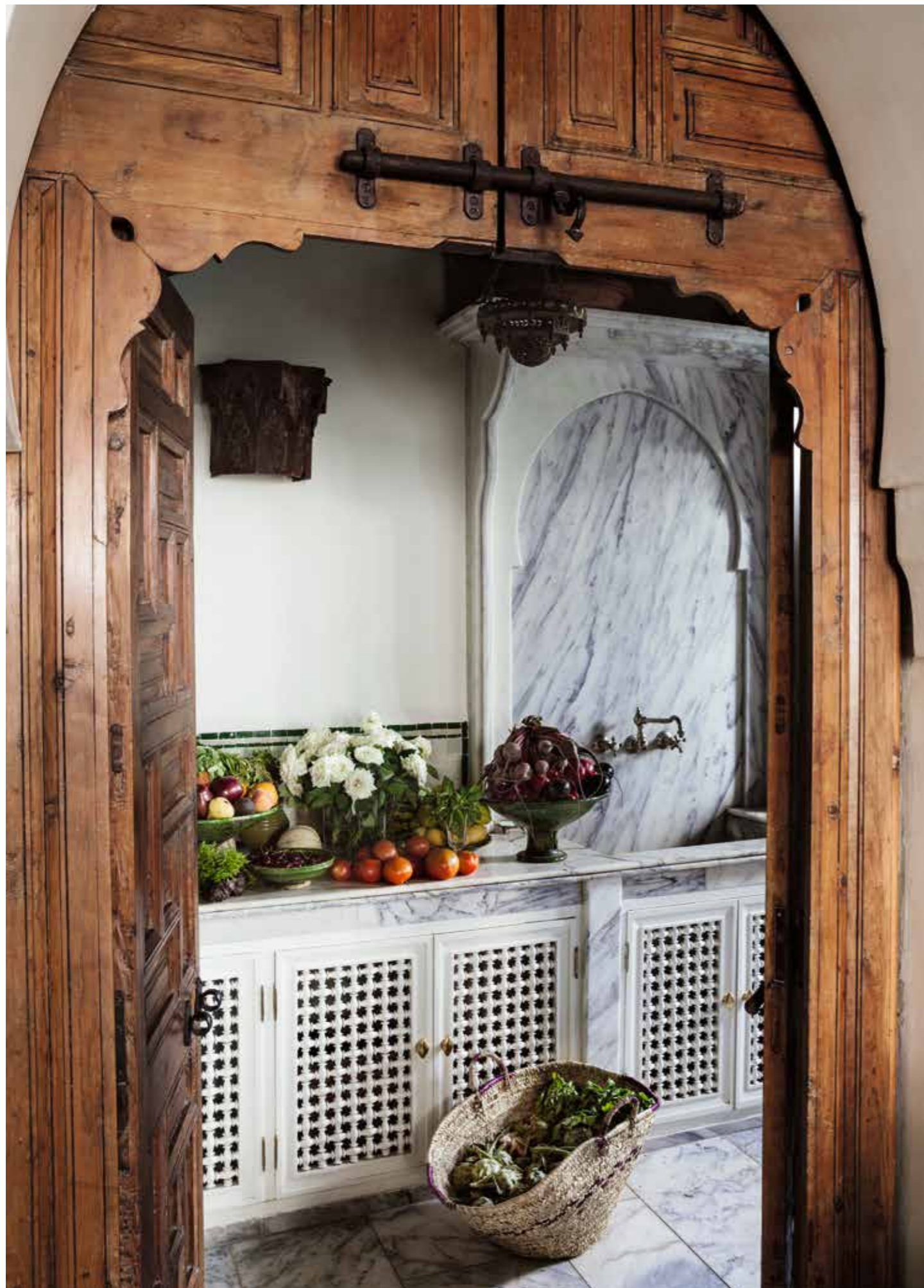
De mooie kastjes in de met marmere geplaveide keuken worden afgesloten met opengewerkte deurtjes ( moucharabihs ).