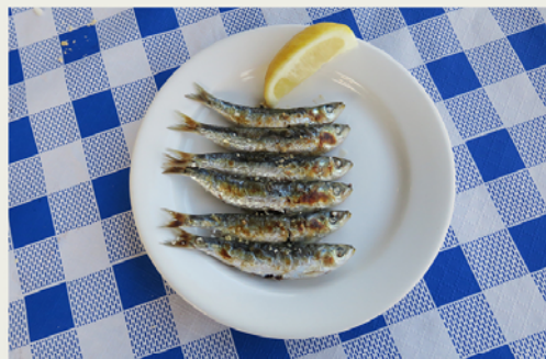
Espetos de sardinas kun je bij iedere chiringuito langs de boulevards bestellen.

Albóndigas (gehaktballetjes in tomatensaus), jamón ibérico , boquerones (ansjovisjes), calamares , tortilla , croquetas , chorizo en berenjenas con miel de caña (gefrituurde aubergine met rietsuikerstroop – favoriet bij veggies): Spanje is het land van de tapas, de traditionele hapjes. Vaak zijn ze eveneens verkrijgbaar als halve of hele portie ( media ración en ración ), voor de grote(re) trek of om met elkaar te delen. In Málaga hoeft je nooit lang te zoeken naar een tapasbar. Een aantrekkelijke variant op die traditionele tapasbar en een voorbeeld van de manier waarop de restaurantwereld zich aan het vernieuwen is, is de gastrobar. In een meestal trendy inrichting staan er ook hier kleine porties op de kaart zodat er naar hartenlust geprobeerd en gedeeld kan worden. Het spectaculaire zit hem in de keuken. De ene gastrobar geeft een verrassende twist aan een bestaande tapa, de andere richt zich op verfijnde fusiongerechtjes. Bij allemaal staat de kwaliteit van de gebruikte producten hoog in het vaandel.