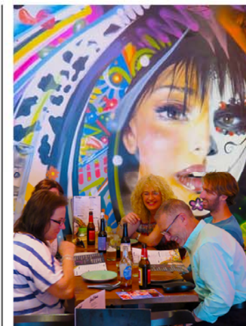
Restaurant Nuevo y Sur, dat streetfood serveert, is in stijl gedecoreerd.

Noviembre 📍 kaart 2, F 4 Voor een verantwoord ontbijt (yoghurt, verse sappen, fruit), al dan niet glutenvrij, kun je terecht in het hippe interieur